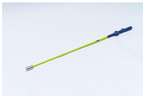
サイコースピーダー

飛距離アップ・スコアアップを望む上達志向のアマチュアゴルファーをサポートすべく、YouTube登録者数41万人超えの大人気ティーチングプロ・菅原大地が『デュアルトレーニングセット(サイコースピーダー、スイングコーチャー)』を一からプロデュース。本製品を使用して素振りを繰り返すことで、菅原プロが提唱する「最大効率スイング」を簡単に学ぶことができます。