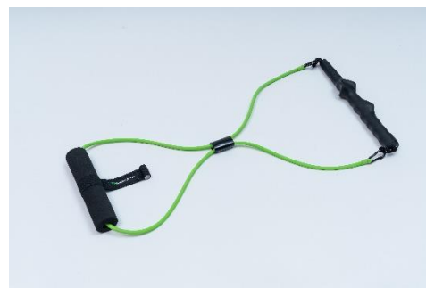
スイングコーチャー